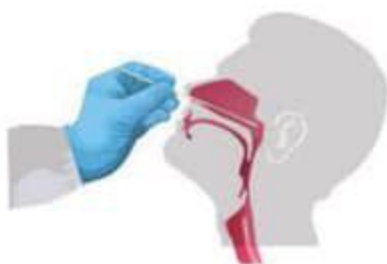
Đưa que lấy mẫu vô trùng vào thẳng phía sau một bên mũi (không hướng lên trên), dọc theo sàn mũi tới khoang mũi hầu

Lưu ý: Đối với trẻ nhỏ đặt ngồi trên đùi của cha/mẹ, lưng của trẻ đối diện với phía ngực cha mẹ. Cha/mẹ cần ôm trẻ giữ chặt cơ thể và tay trẻ. Yêu cầu cha/mẹ ngả đầu trẻ ra phía sau.