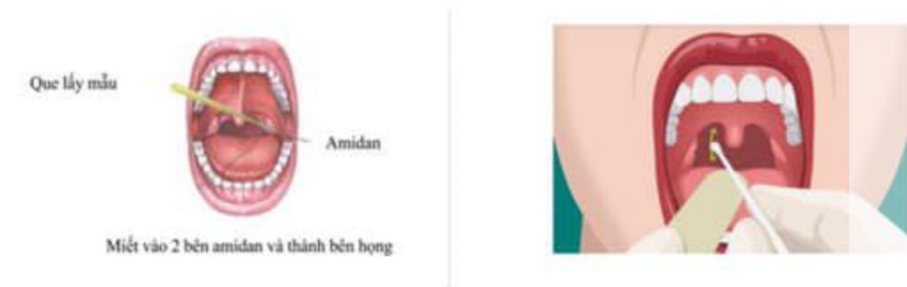
Hình 2: Lấy mẫu ngoáy dịch họng