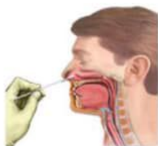
Hình 3. Lấy mẫu ngoáy dịch mũi